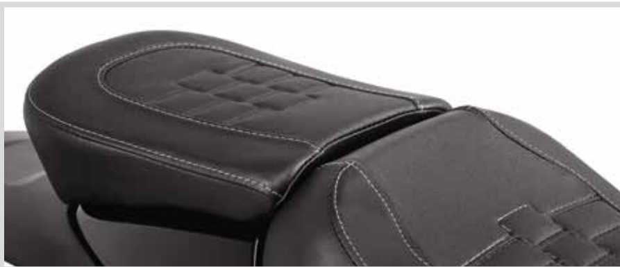
G. SUNDOWNER SOZIUSSITZ

Für RH1250S Modelle ab '21 mit Sundowner Solo Sitz P/N 52000510. Der Einbau erfordert Soziusfußrasten und das Soziusfußrasten-Montagekit P/N 50502192.