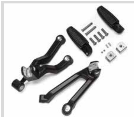
I. MONTAGEKIT FÜR SOZIUFSFUSSRASTEN

E. WILD ONE™ KOLLEKTION – HINTERER BREMSHEBEL Hervorhebungen in maschinell bearbeitetem Aluminium. Vervollständigen Sie dieses Custom-Design mit weiteren Zubehörteilen aus der Wild One Kollektion.