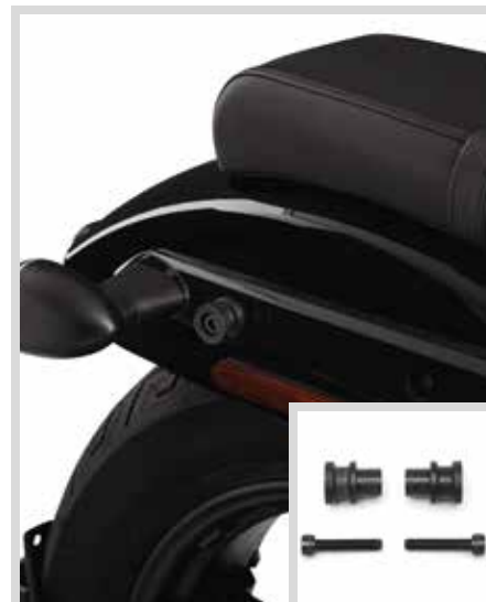
C. HOLDFAST MONTAGEKIT