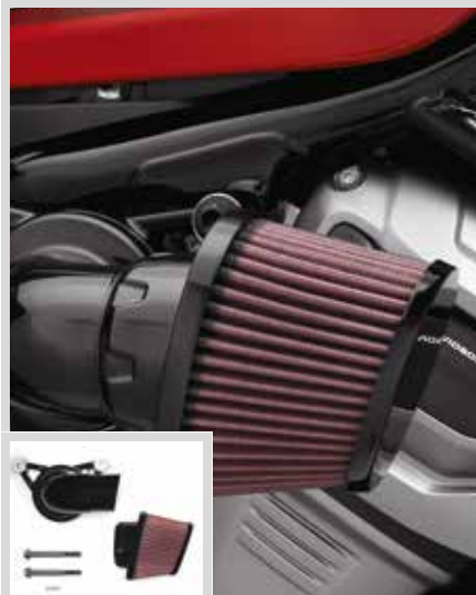
F. HEAVY BREATHER LUFTFILTER – SCHWARZ