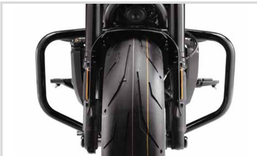
D. MOTORSCHUTZBÜGEL – SCHWARZGLÄNZEND

49000255 Für RH1250S, RH975 und RH975S Modelle ab '21.