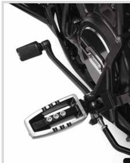
C. KIT FÜR MITTIGE FUSSRASTENANLAGE