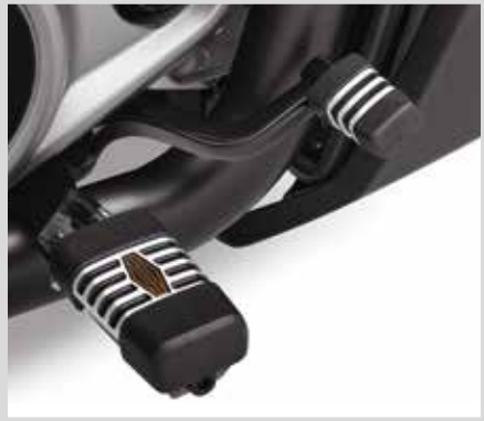
G. HINTERER BREMSHEBEL DER '66 KOLLEKTION