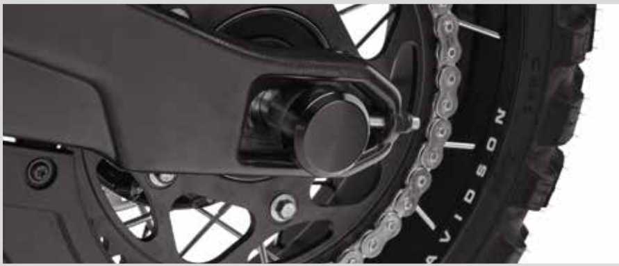
I. MUTTERNKAPPEN FÜR DIE HINTERACHSE – SCHWARZGLÄNZEND

Für RA1250, RA1250S und RH1250S ab '21 sowie RA1250SE Modelle ab '24.