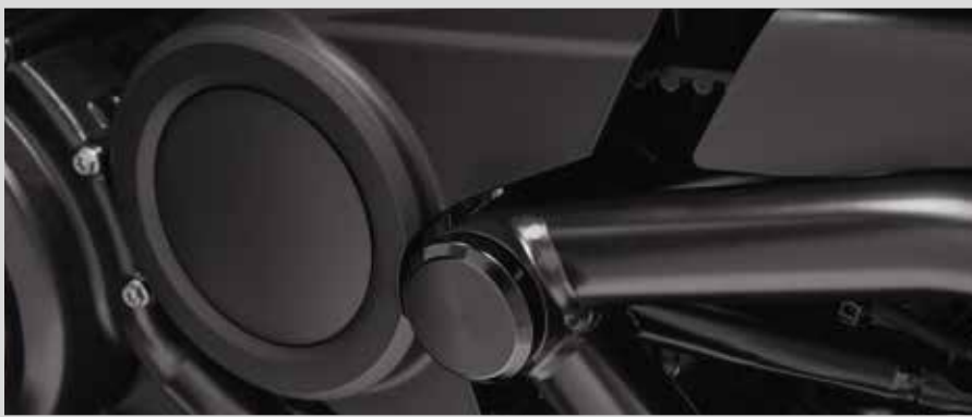
J. ABDECKUNGEN FÜR SCHWINGENACHSBOLZEN – SCHWARZGLÄNZEND