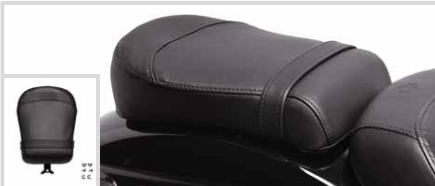
B. SUNDOWNER SOZIUSSITZ

Für RH975 Modelle ab '22 mit Original- oder Sundowner Solo Sitz. Der Einbau erfordert Soziusfußrasten und das Soziusfußrasten-Montagekit P/N 50502434.