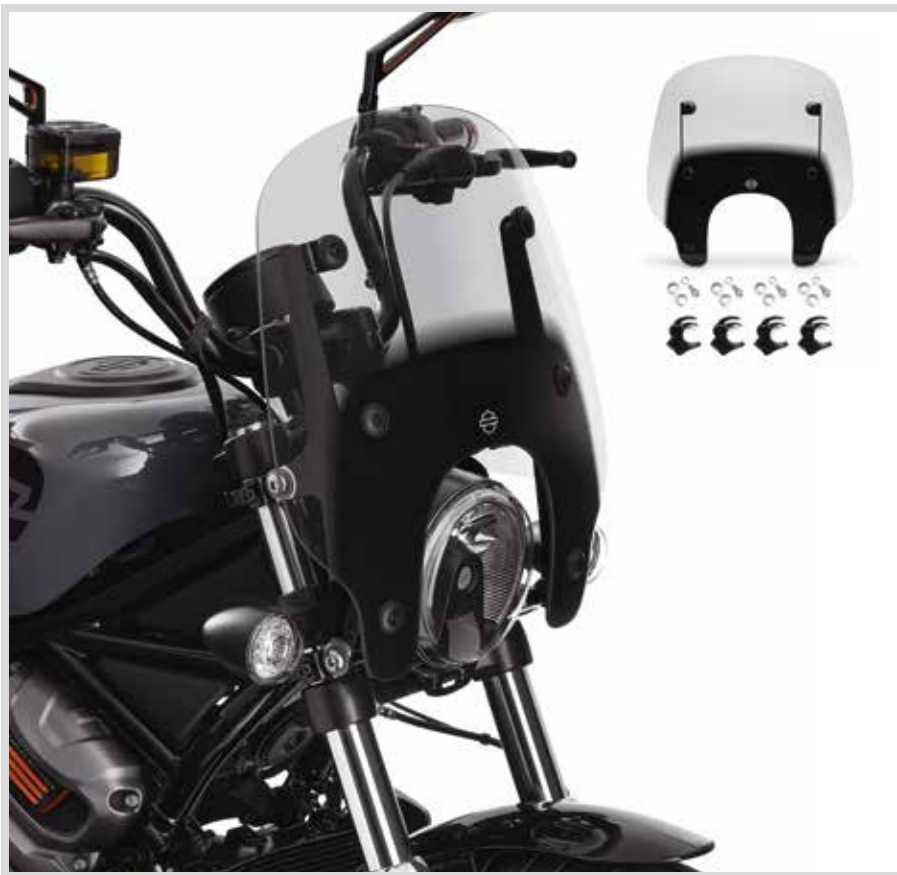
B. ABNEHMBARE KOMPAKT-WINDSCHUTZSCHEIBE – LEICHT GETÖNT