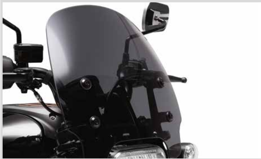
C. ABNEHMBARE KOMPAKT-WINDSCHUTZSCHEIBE – DUNKEL GETÖNT