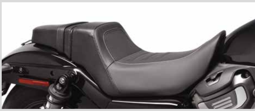
E. SWITCHBACK SITZ – NIGHTSTER