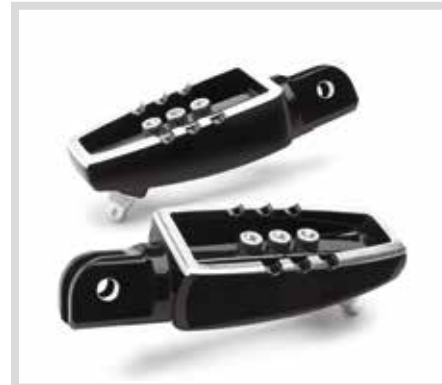
C. WILD ONE KOLLEKTION – FAHRERFUSSRASTEN