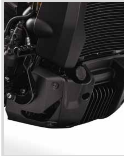
B. CHIN GUARD