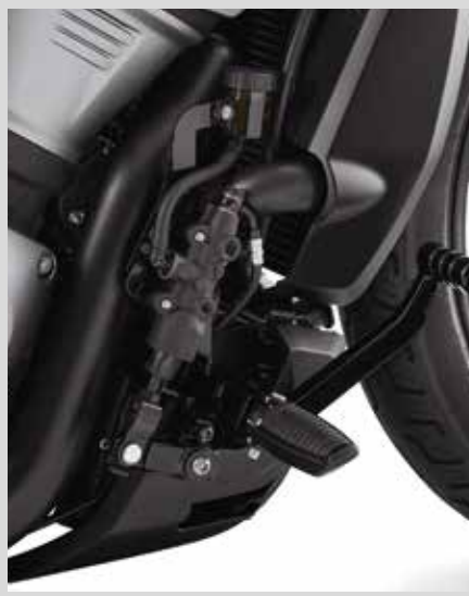
A. KIT FÜR VORVERLEGTE FUSSRASTENANLAGE – SCHWARZGLÄNZEND

Für RH975 Modelle ab '22 und RH975S ab '23 ohne Motorschutzbügel geeignet. Erfordert Chin Guard P/N 57200347.