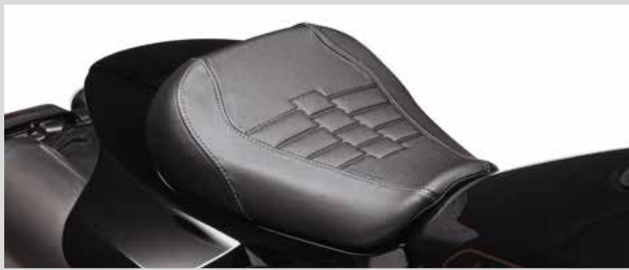
F. SUNDOWNER SOLO SITZ – SPORTSTER S MODELL