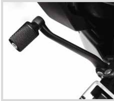
F. WILD ONE KOLLEKTION – SCHALTHEBELRASTE