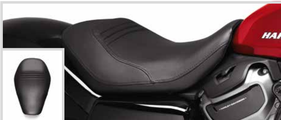
C. REACH SOLO SITZ