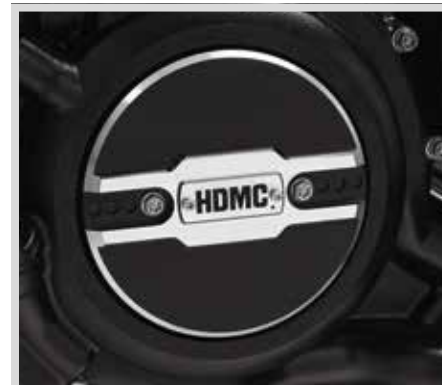
E. WILD ONE KOLLEKTION – ABDECKUNG FÜR LICHTMASCHINENSTECKER

Für Modelle ab '21 mit Revolution Max Motor.