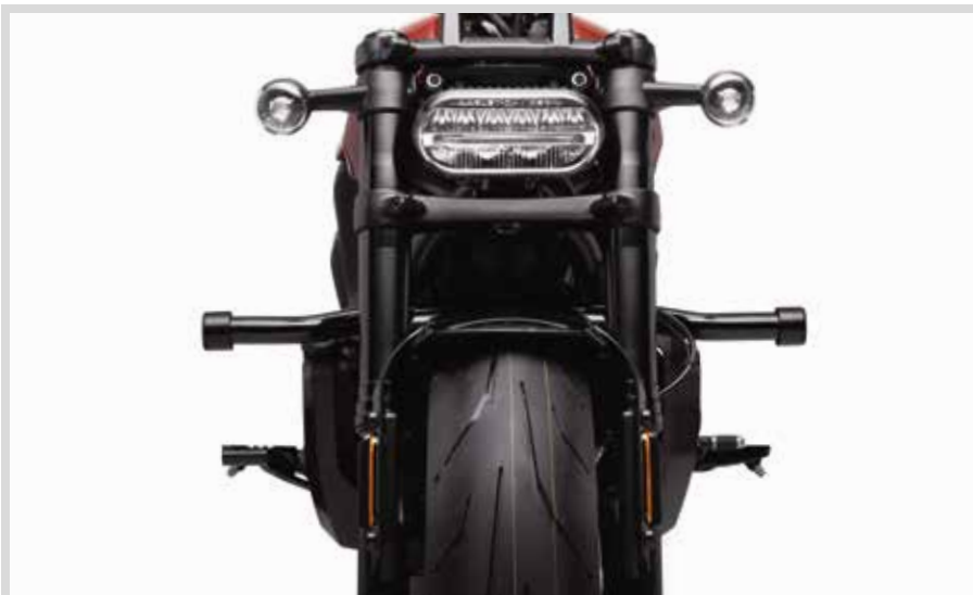
E. FLAT-OUT BAR – SCHWARZ