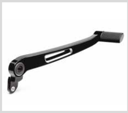
E. WILD ONE KOLLEKTION – HINTERER BREMSHEBEL