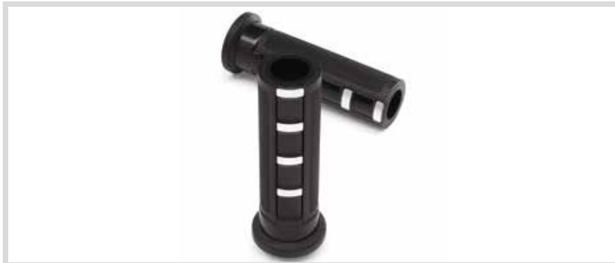
A. WILD ONE KOLLEKTION – LENKERGRIFFE

Beheizt. Für RA1250S, RH1250S und RH975S Modelle ab '21. RH1250S und RH975S Modelle erfordern ein Digital Technician™ Update seitens des Harley-Davidson® Händlers.