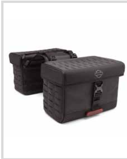
D. OVERWATCH THROW-OVER SATTEL TASCHEN