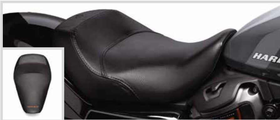
A. SUNDOWNER SOLO SITZ – NIGHTSTER