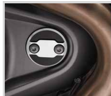
G. WILD ONE KOLLEKTION – TIMER-MEDAILLON

Für Modelle ab '21 mit Revolution Max Motor.