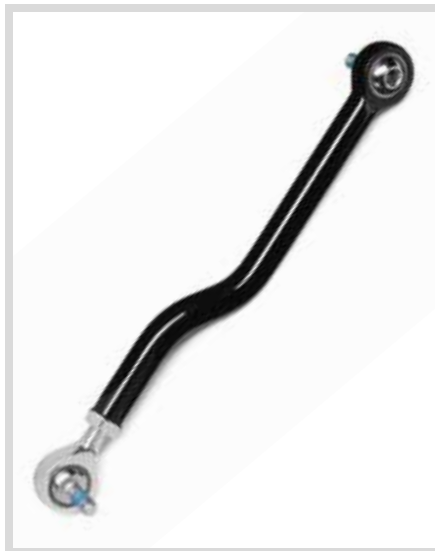
D. SCHWARZES SCHALTGESTÄNGE