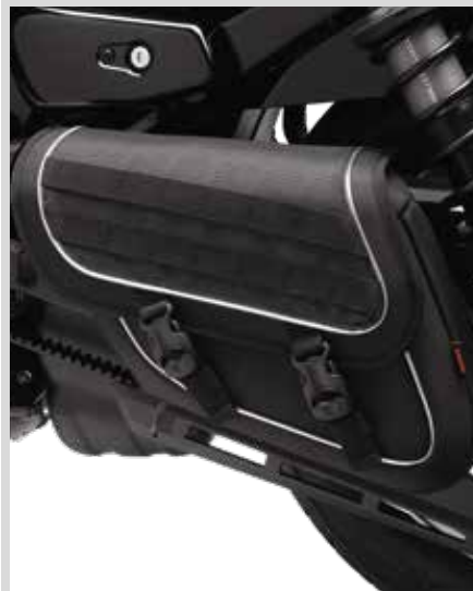
I. EINSEITIGE SCHWINGENTASCHE – MODERN