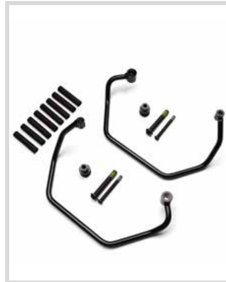
E. THROW-OVER SATTEL TASCHENTRÄGER – NIGHTSTER