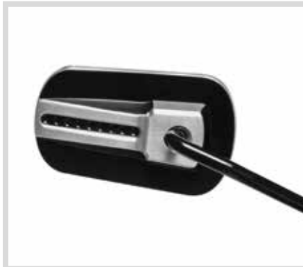
B. WILD ONE KOLLEKTION – SPIEGEL

Für Modelle ab '21 mit Revolution Max Motor. RH975, RH975S und RH1250S Modelle erfordern die Lenkerendkappe P/N 55801095, 55900246, 55900247 oder 55900248.