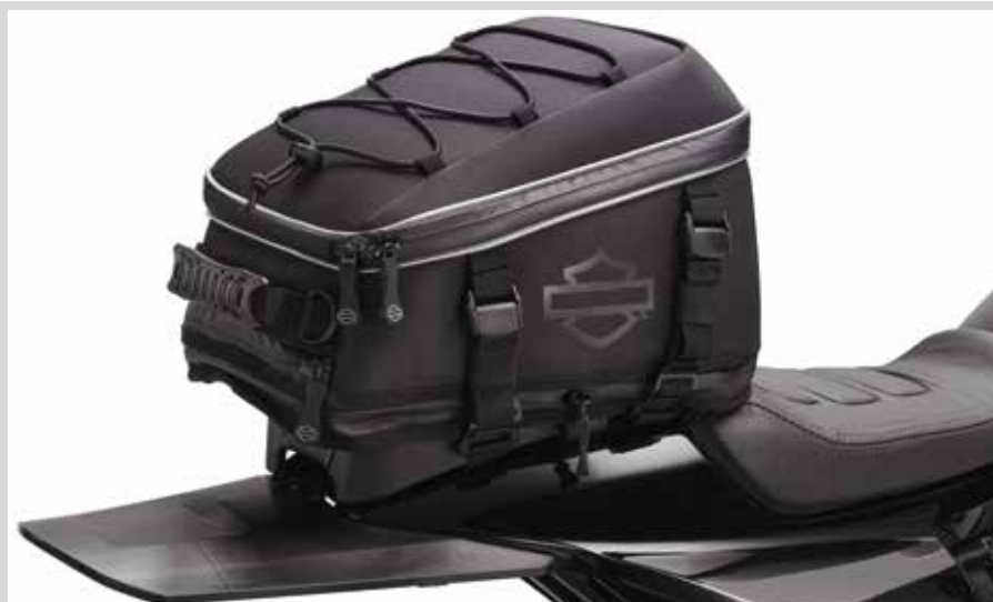
G. HECKTASCHE – SPORTSTER S MODELL