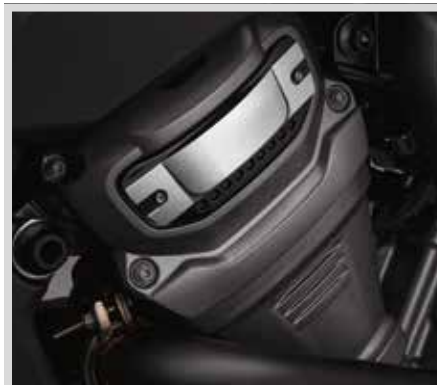
D. WILD ONE KOLLEKTION – NOCKENWELLENRAD-MEDAILLONS

Für Modelle ab '21 mit Revolution Max Motor.