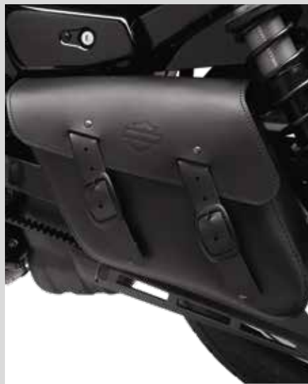
H. EINSEITIGE SCHWINGENTASCHE – KLASSISCH

Für RH1250S ab '21 sowie RH975 und RH975S Modelle ab '22. RH1250S Modelle erfordern die Halterung P/N 90202533. RH975 Modelle erfordern die Halterung P/N 90202532.