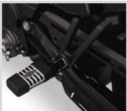
I. MONTAGEKIT FÜR SOZIUFSFUSSRASTEN