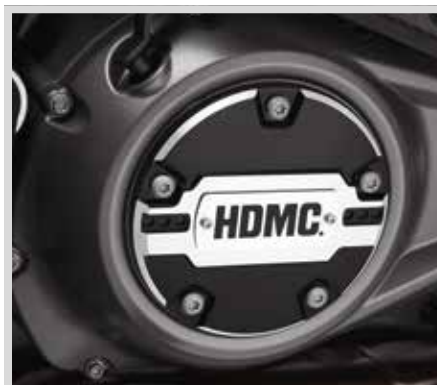
F. WILD ONE KOLLEKTION – KUPPLUNGS-MEDAILLON

Für Modelle ab '21 mit Revolution Max Motor.