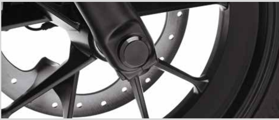
H. MUTTERNKAPPEN FÜR VORDERACHSE – SCHWARZGLÄNZEND