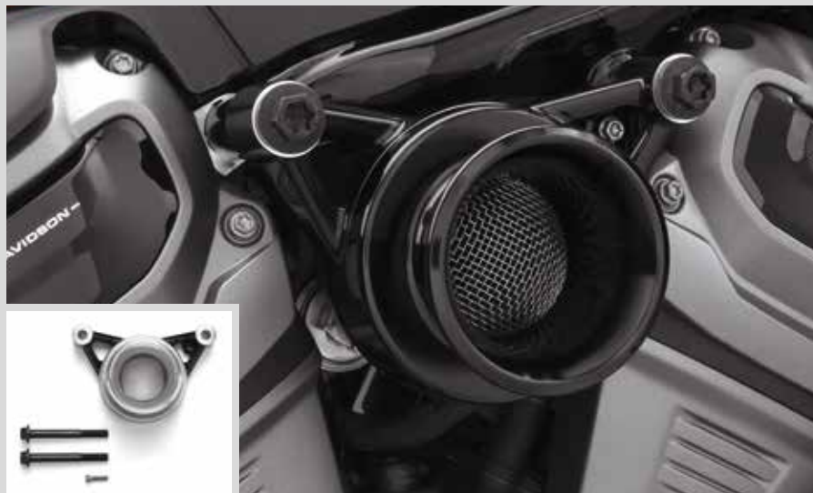
G. VELOCITY STACK – SCHWARZ (GEZEIGT: ROHER EINSATZ)