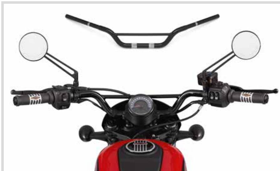
D. TRACKER LENKER

HINWEIS: Manche Lenker und Riser können bei bestimmten Modellen Modifikationen an Kupplungs- und/oder Gaszug und Bremsleitungen erfordern. In vielen Ländern ist die Lenkerhöhe gesetzlich geregelt. Informieren Sie sich über die örtlichen Gesetze, um sicherzustellen, dass Ihr Motorrad alle einschlägigen Vorschriften erfüllt.