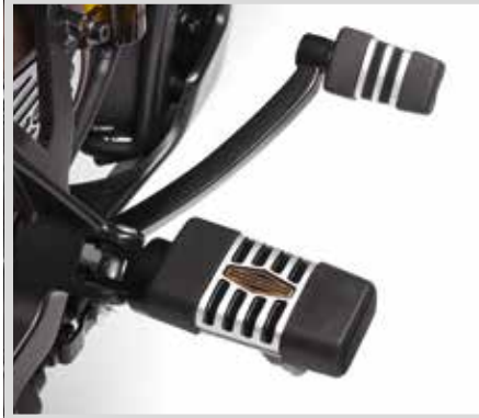
G. HINTERER BREMSHEBEL DER '66 KOLLEKTION