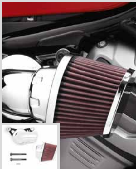
F. HEAVY BREATHER LUFTFILTER – CHROM