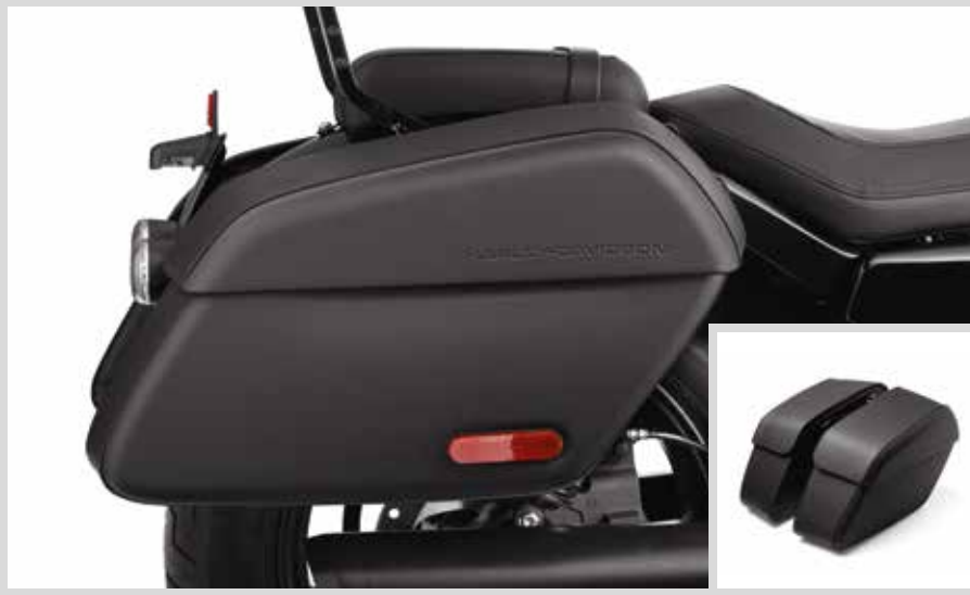
F. ABNEHMBARE SATTELTASCHEN