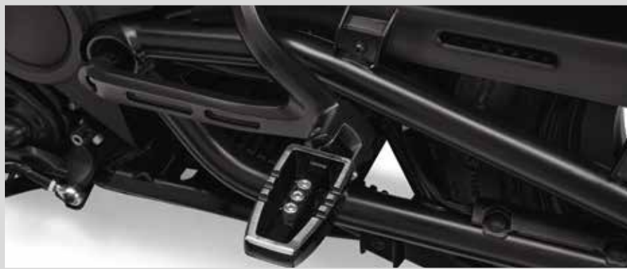
H. MONTAGEKIT FÜR SOZIUFSFUSSRASTEN (ABGEBILDET MIT SOZIUFSFUSSRASTE P/N 50502026)