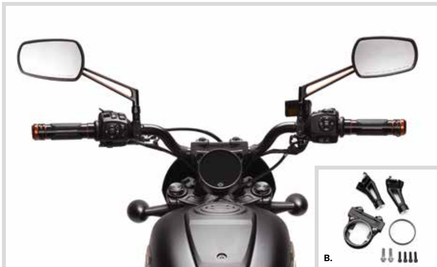
A. MOTO BAR – NIGHTSTER

Für RH1250S ab '21 und RH975 Modelle ab '22.