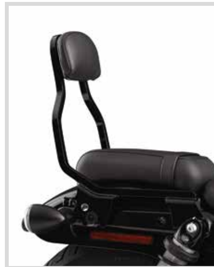
A. HOLDFAST SISSY BAR BÜGEL – NIEDRIGE HÖHE – SCHWARZGLÄNZEND