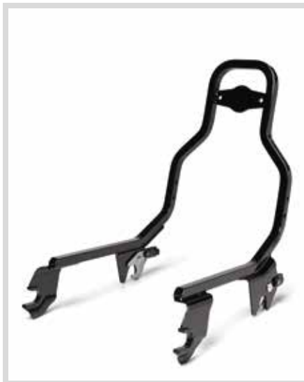
A. HOLDFAST SISSY BAR BÜGEL – NIEDRIGE HÖHE – SCHWARZGLÄNZEND